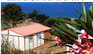
Informations sous réserve de modification