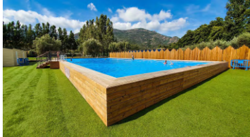
Informations sous réserve de modification