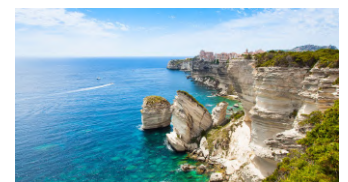
Informations sous réserve de modification