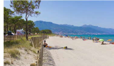
Informations sous réserve de modification